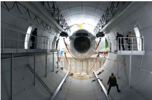
Bild 1: Das Fraunhofer IBP verfügt an seinem Standort in Holzkirchen über eine weltweit einmalige Testeinrichtung, die »Flight Test Facility«. Schon bald kommt ein ebenfalls einmaliger thermischer Prüfstand, die Ground Thermal Test Bench, hinzu.